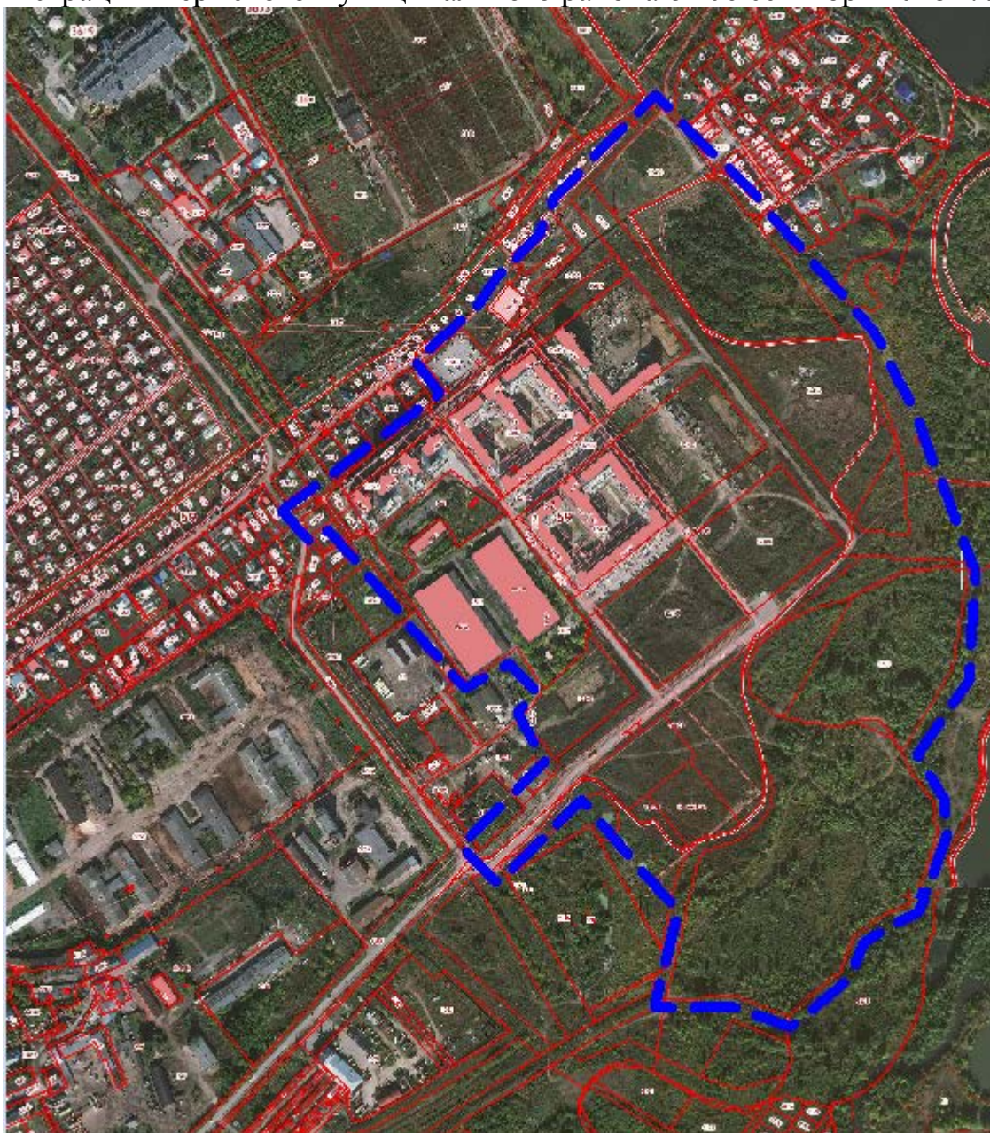
Схема для разработки проекта внесения изменений в проект планировки части территории д. Кондратово Кондратовского сельского поселения Пермского муниципального района Пермского края, утвержденный постановлением администрации Пермского муниципального района от 06 сентября 2018 г. № 456